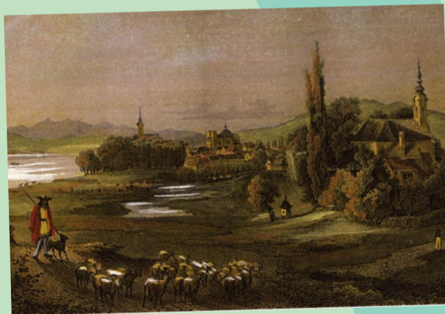
Rohbock: Vác látképe délről, a Hétkápolna felől (kézzel színezett acélmetszet, 19. század 2. fele) Tragar Ignác Múzeum, Vác